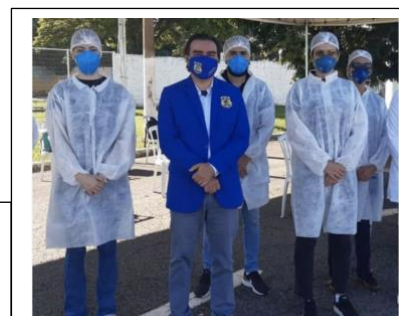
Equipe de peritos apoiando vacinação em Goiás